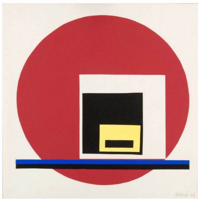
Sans Titre, 1971