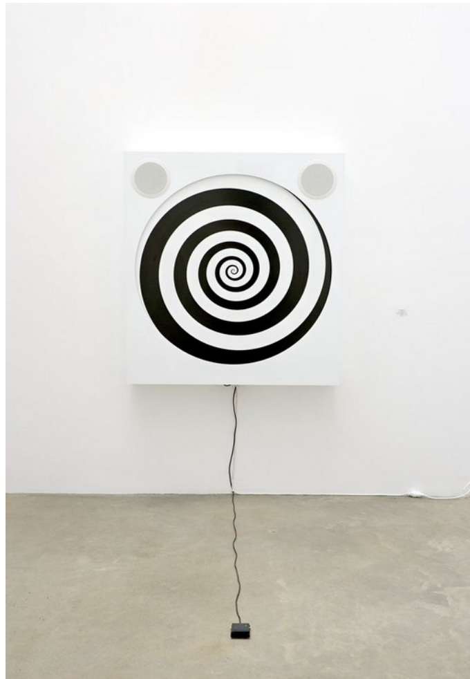
Alain Séchas, Hommage à Émile Coué , 2006

Inspirez vous de l'œuvre de Séchas et créez une toupie qui vous donnera le tournis !