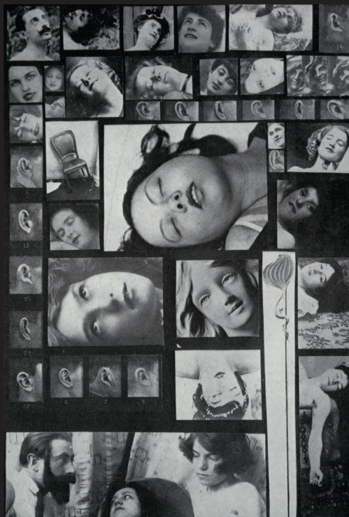
Salvador Dalí, Le Phénomène de l'extase © Salvador Dalí, Fundació Gala-Salvador Dalí / ADAGP, Paris, 2020

De 1922 à 1924, avant la naissance officielle du surréalisme, Robert Desnos et René Crevel expérimentent une nouvelle méthode introspective : le sommeil hypnotique. Lors de ces séances d'hypnose s'apparentant à des réunions spirites, Desnos déclame des poèmes ou réalise des dessins automatiques.