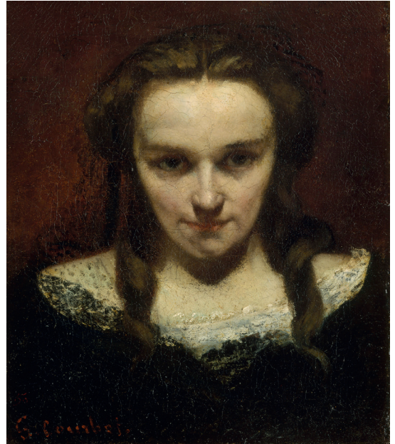
Gustave Courbet, La Voyante ou La somnambule , vers 1855, © Musée des beaux-arts et d'archéologie de Besançon - Photo C. Choffet

La figure du somnambule est un thème récurrent du romantisme et du symbolisme. Maxmilián Pirner représente La somnambule dans une ambiance étrange, voire surnaturelle. Théophile Bra expérimente la création sous état somnambulique, ouvrant la voie à l'écriture automatique. Dans les années 1850, certains artistes s'intéressent aux phénomènes et aux sciences occultes. La créativité prend sa source dans le pouvoir de l'imagination, sous état modifié de conscience. Ainsi, Gustave Courbet réalise l'étonnante Voyante dite aussi La somnambule au regard perçant, qui paraît absorbée par une force mystérieuse.