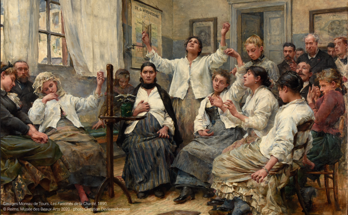
Georges Moreau de Tours, Les Fascinés de la Charité , 1890.