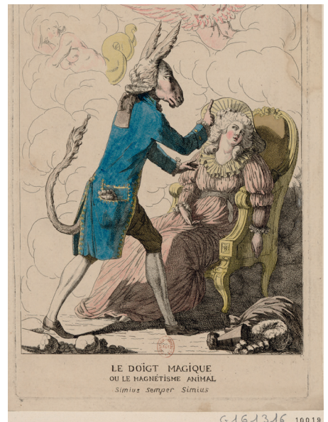
Anonyme, Le doigt magique ou le magnétisme animal - Simius semper simius , 1784, Paris, © Bnf-Gallica

d'un état modifié de conscience qui, suite à diverses évolutions conceptuelles, prend le nom d'« hypnose ».